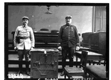
La cuisinière de Landru