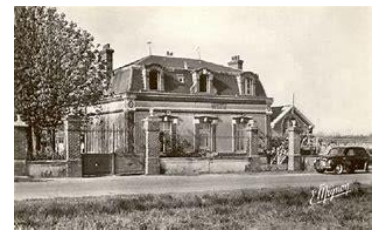
La Villa de Gambais