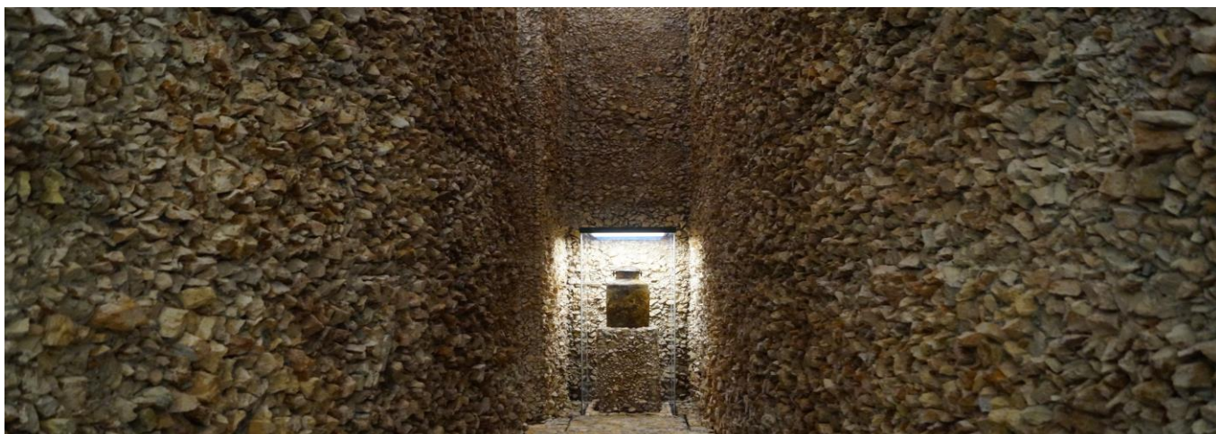
Jarre de lait présentée à l'Institut historique juif de Varsovie. Exhumée en 1946 cette jarre contenait une partie des archives Ringelblum.

Après-guerre dans les ruines du ghetto, des fouilles ont permis de retrouver des documents relatant le sort de la communauté juive de Varsovie. Ces témoignages uniques sont passés à la postérité sous le nom d'Archives Ringelblum.