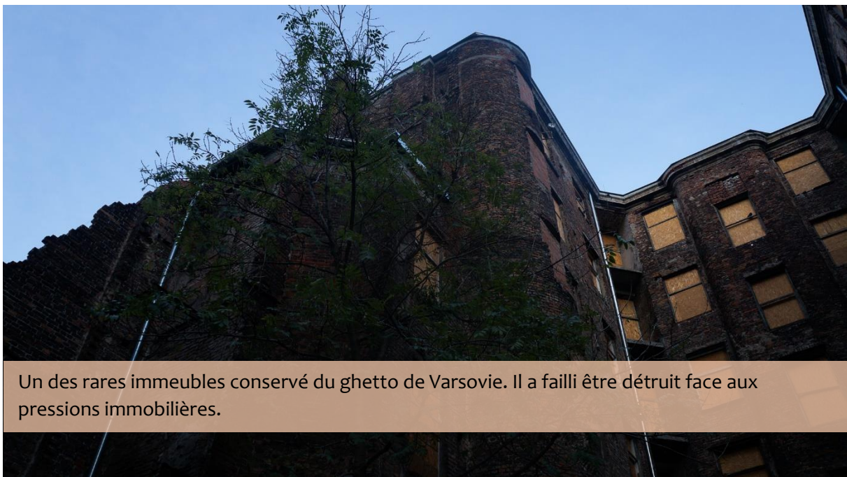
Un des rares immeubles conservé du ghetto de Varsovie. Il a failli être détruit face aux pressions immobilières.

Le ghetto de Varsovie était le plus important ghetto juif au sein des territoires d'Europe sous domination nazie. Si aujourd'hui, le temps a repris ses droits, les lieux portent toujours les stigmates d'un quotidien révolu.