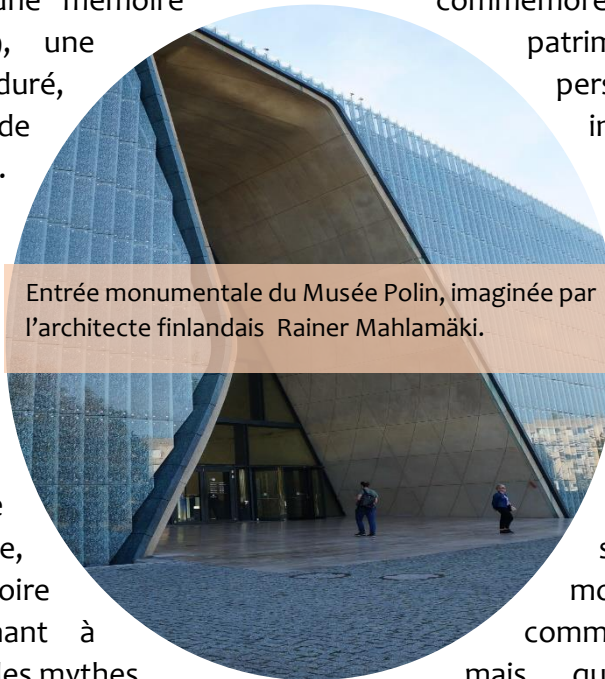
Entrée monumentale du Musée Polin, imaginée par l'architecte finlandais Rainer Mahlamäki.

L'ouverture de l'exposition en 2014 a suscité de vives polémiques, rappelant que la tentation de l'oubli n'est jamais loin et que le travail de mise en lumière de cette mémoire douloureuse demeure une recherche, un processus d'exhumation constant.